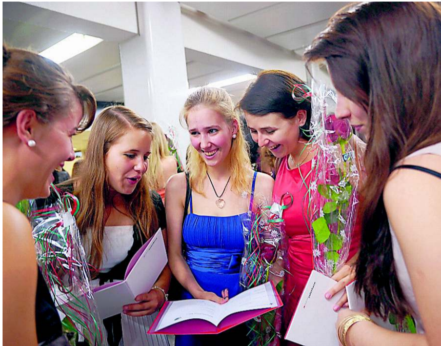
Schülerinnen der Fachmittelschule FMS freuen sich über ihre gute Noten im Zeugnis. HJS