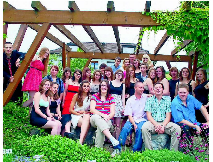
Talente auf Umwegen oder auf Umwegen zum Talent. Das war das Motto der Abschlussfeier Startpunkt Wallierhof Schuljahr 2010–2012.